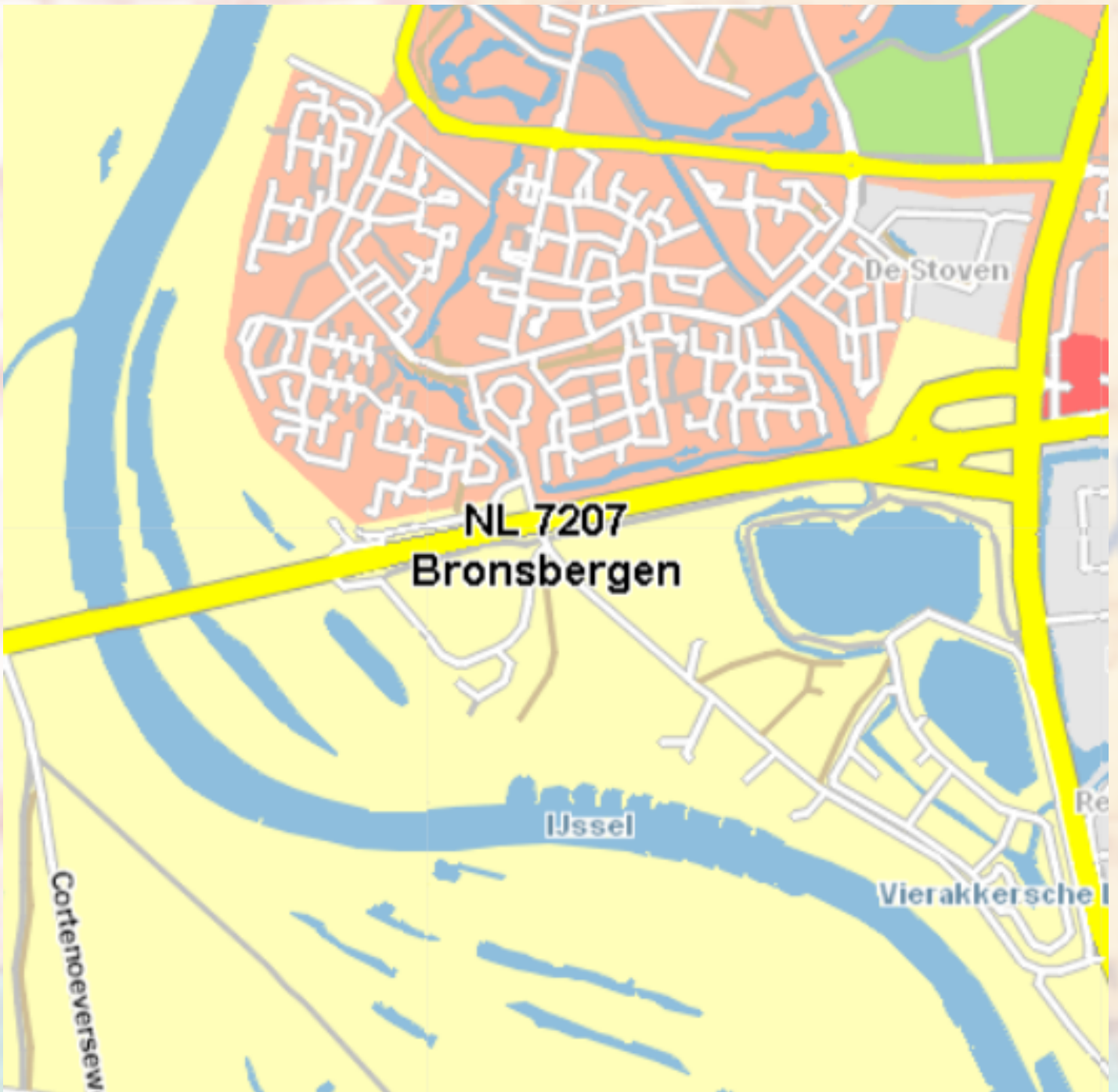
Bijlage: Plattegrond Zuidwijken van Zutphen en Bronsbergen.